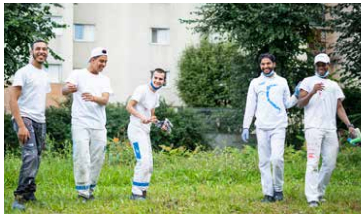
Los alumnos del Centro de Formación de Aprendices (CFA) pintan la pared de su escuela.