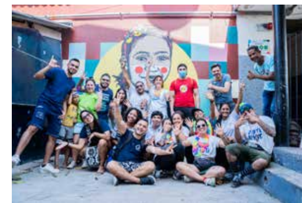
La fresque réalisée à l'entrée de l'école. Entourée de livres, une jeune fille lit, s'instruit et rêve.