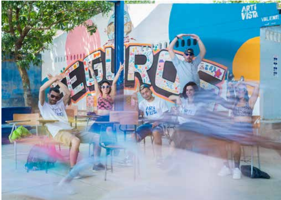
Après l'effort, un moment de récréation mérité. Después del esfuerzo un merecido momento de recreo

Street artistes sans frontière Artistas urbanos sin fronteras