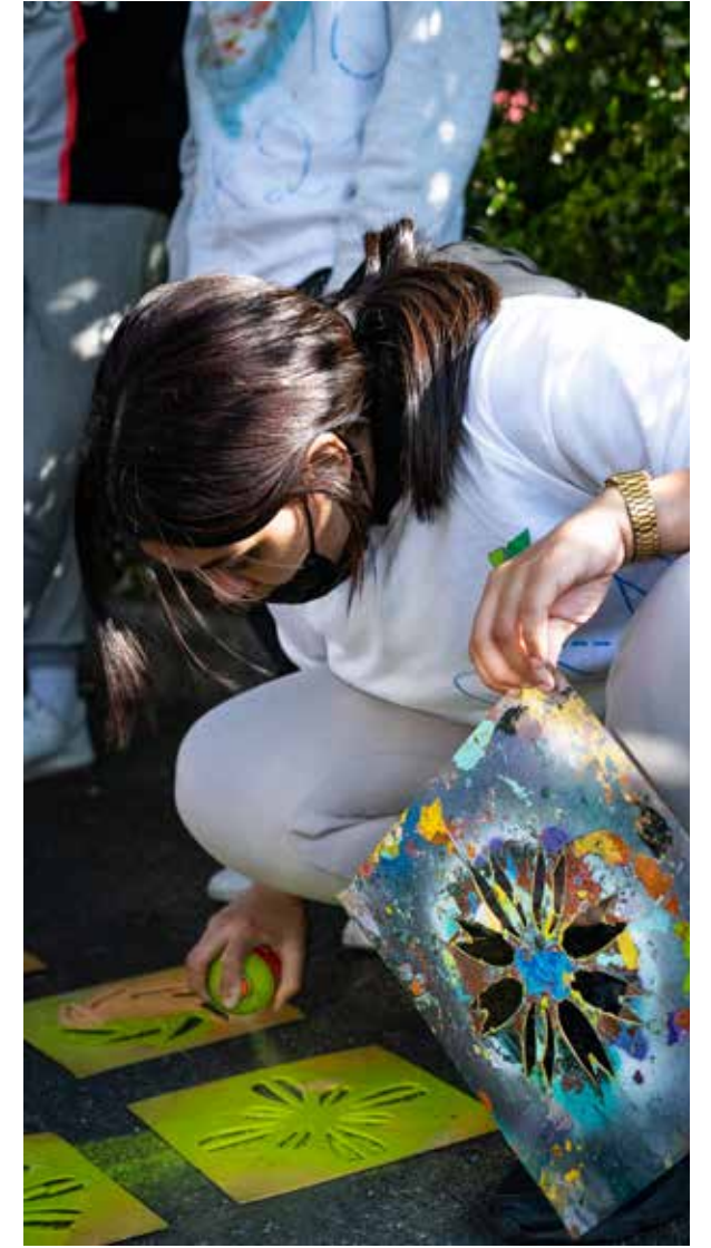
Los grandes utilizan las plantillas para pintar señales en el suelo.