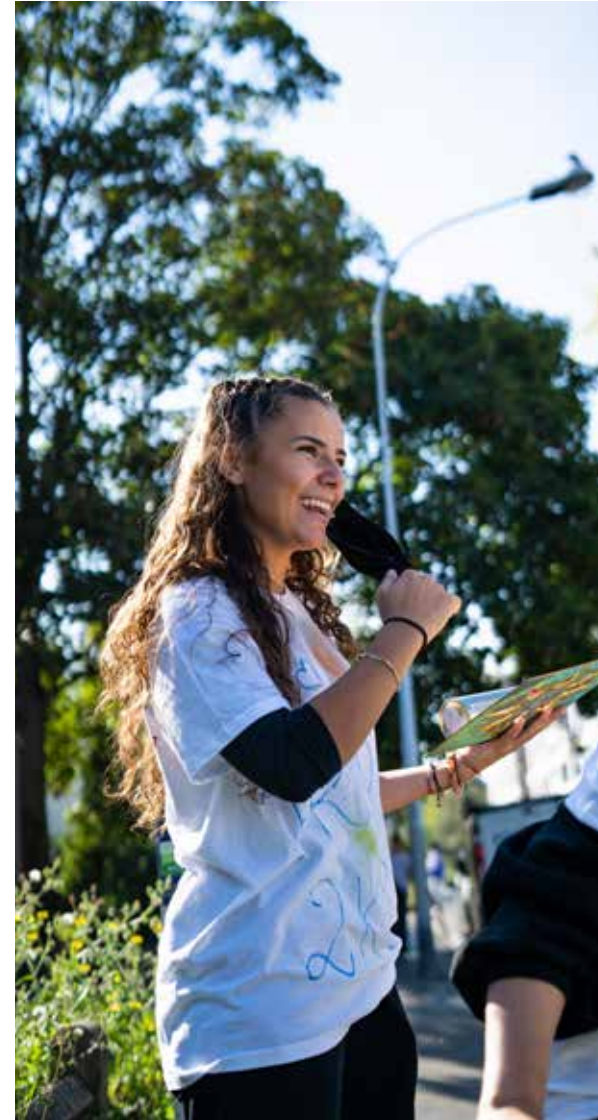
Les pochoirs réalisés par les plus grands sont peints sur le sol en guise de signalétique.