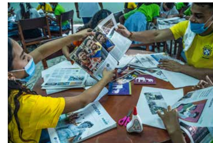
Au cours de l'atelier collage, dans le cadre du programme Valiente, consacré au thème du corps.

Durante el taller de collage, que forma parte del programa Valiente, dedicado al tema del cuerpo.