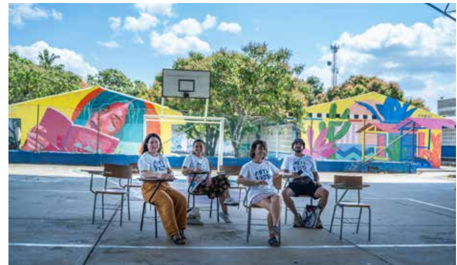
Sur les bancs de l'école, une équipe joyeuse et turbulente.

Sentado en los pupitres de la escuela, nuestro alegre y turbulento equipo