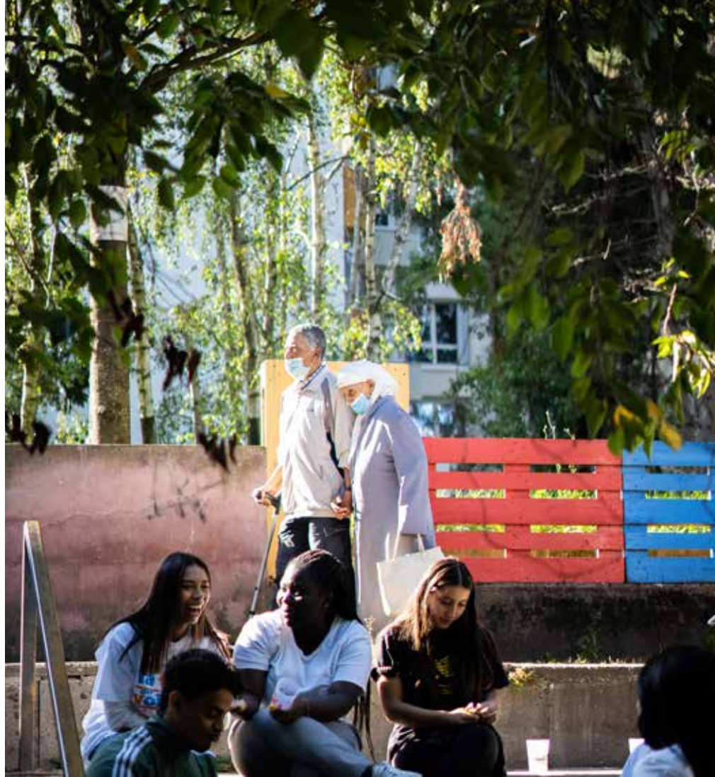
Dans les rues de Saint-Denis, promeneurs et curieux se mêlent aux artistes et bénévoles. En las calles de Saint-Denis, transeúntes y curiosos se encuentran con artistas y voluntarios.