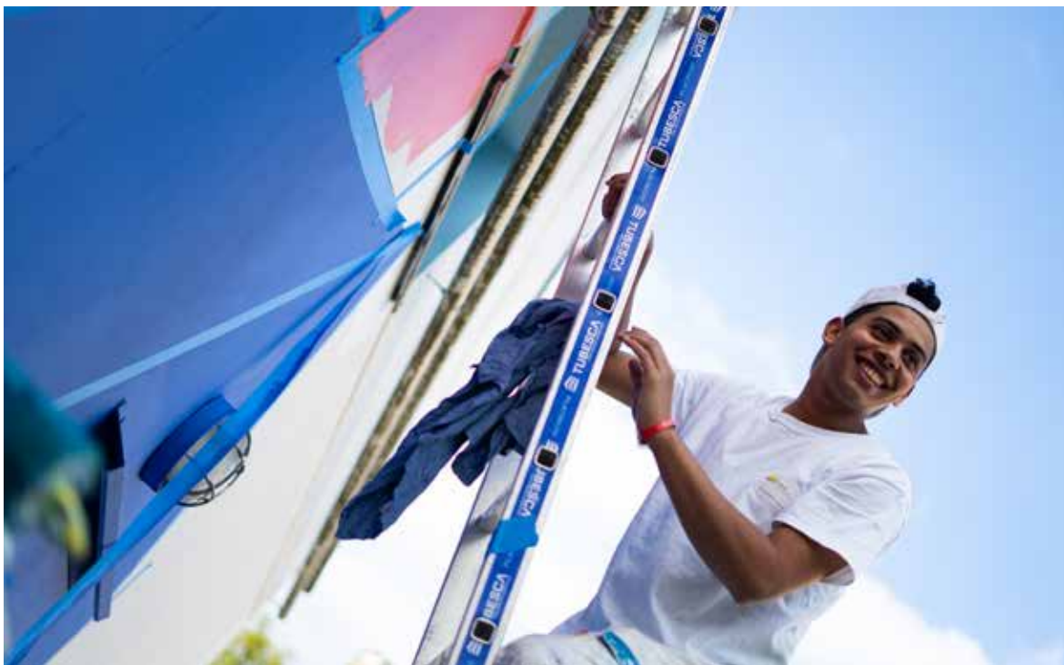
Des élèves du Centre de formation d'apprentis (CFA) peignent le mur de leur école.