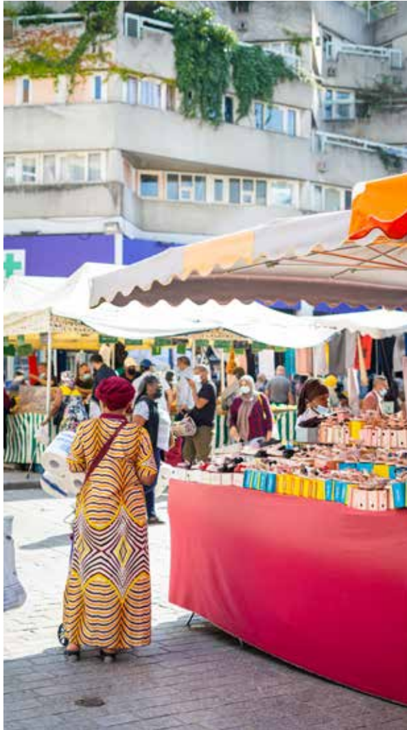
Jour de marché à Saint-Denis. Día de mercado en Saint-Denis