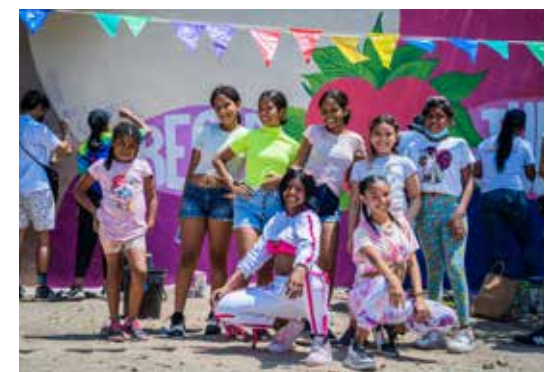
Les jeunes se sont réappropriés une rue du quartier de la Luz où sévissaient des trafics en tous genres. Los jóvenes recuperaron una calle del barrio de la Luz donde había todo tipo de tráfico.