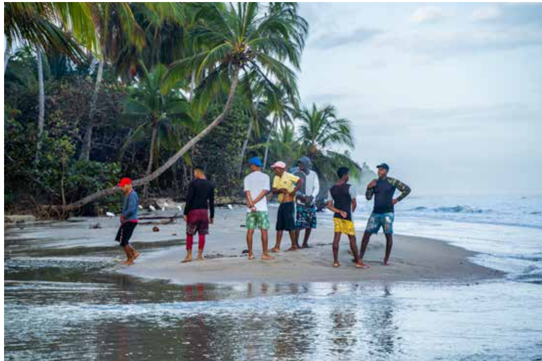
Les pêcheurs présents de bon matin sur la plage de Dibulla, en Colombie. Pescadores al amanecer en la playa de Dibulla, Colombia.

La idea de un intercambio artístico entre su país y Francia fue obra de tres voluntarios colombianos de Artivista. Un sueño que se ha hecho realidad en dos ciudades de la costa caribeña, en Dibulla, un modesto pueblo de pescadores de población diversa, y en Barranquilla, en el barrio de La Luz afectado por problemas de inseguridad y violencia.