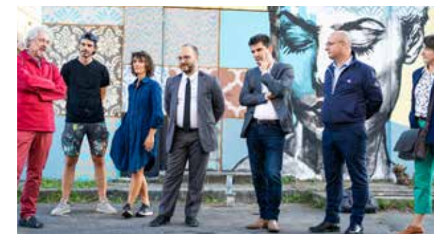
L'inauguration officielle des fresques, à l'IUT.